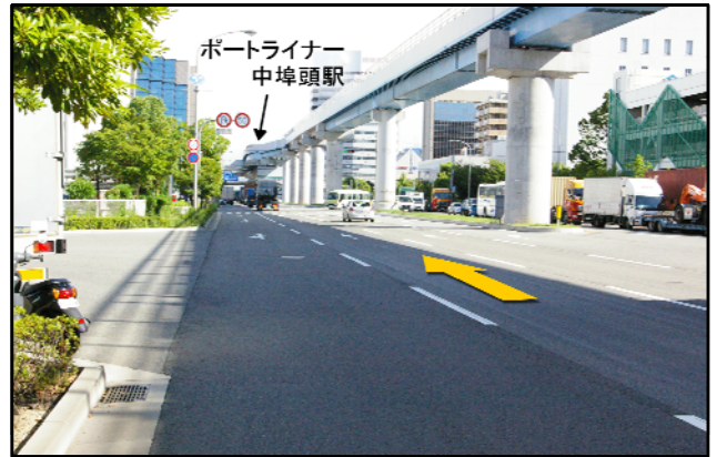
④ 港島トンネルを出てしばらく直進です。