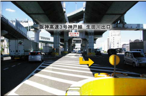
① 生田川出口を出て一般道を左折。