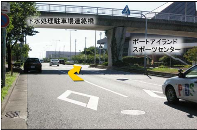
⑦ 下水処理場駐車場連絡橋を越えてすぐの交差点を右折です。