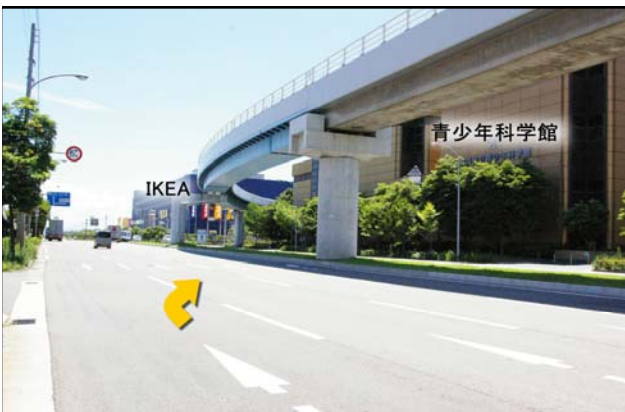
⑤ 青少年科学館・IKEA前の交差点を右折です。