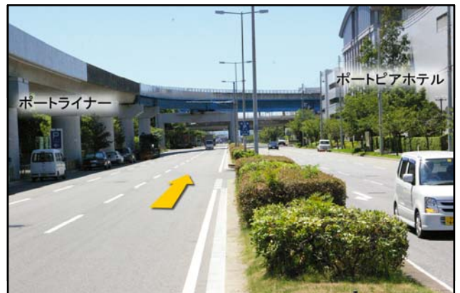
⑥ しばらく直進しポートピアホテル前、ポータルライナーの高架下を通過。